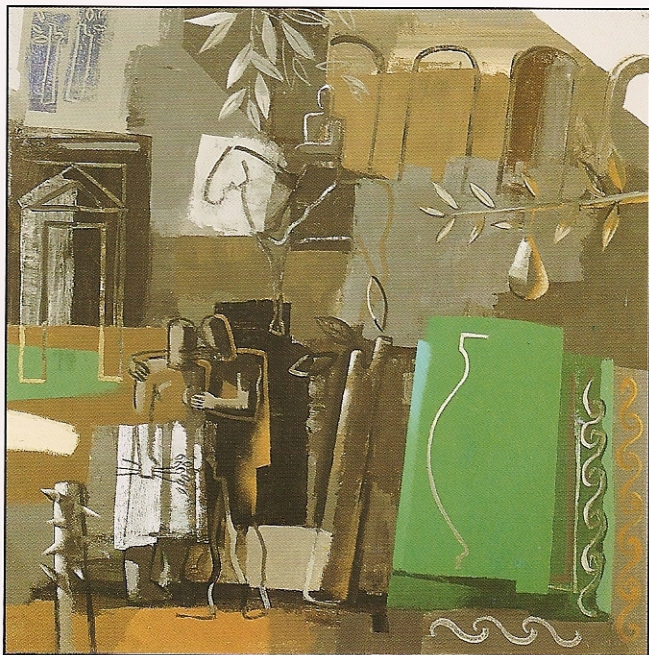
"El vigilante del amor herido" Acrílico sobre lienzo, 90 x 90 cms., 1993