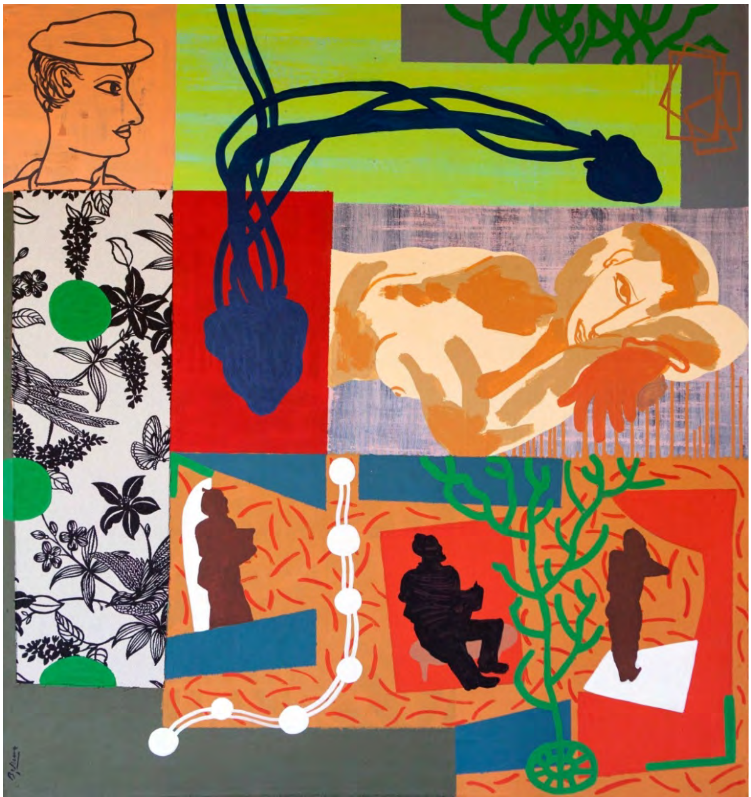
El estudio. 119 x 109 cm. Acrílico/tabla. 2014