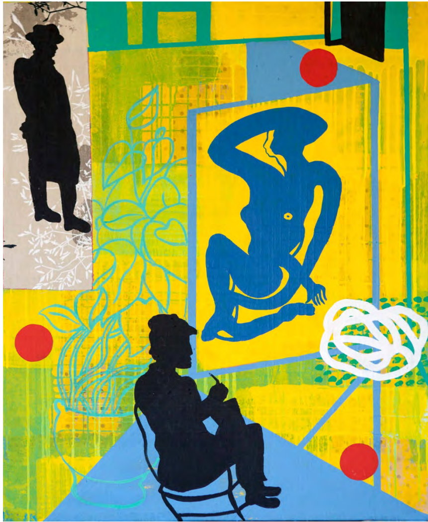
El estudio, 95'5 x 75 cm. Acrílico/tabla. 2014