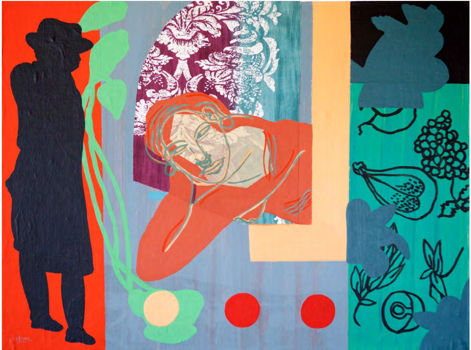
El estudio. 73 x 94 cm. Acrílico/tabla. 2014.