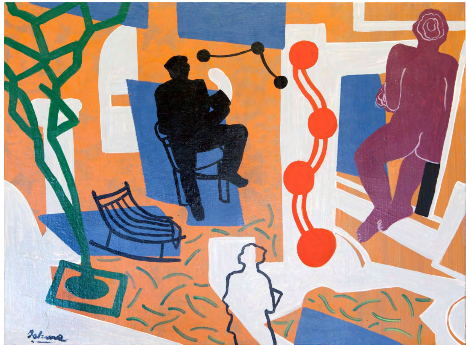
El estudio.48'5 X 63'5 cm. Acrílico/tabla. 2013.