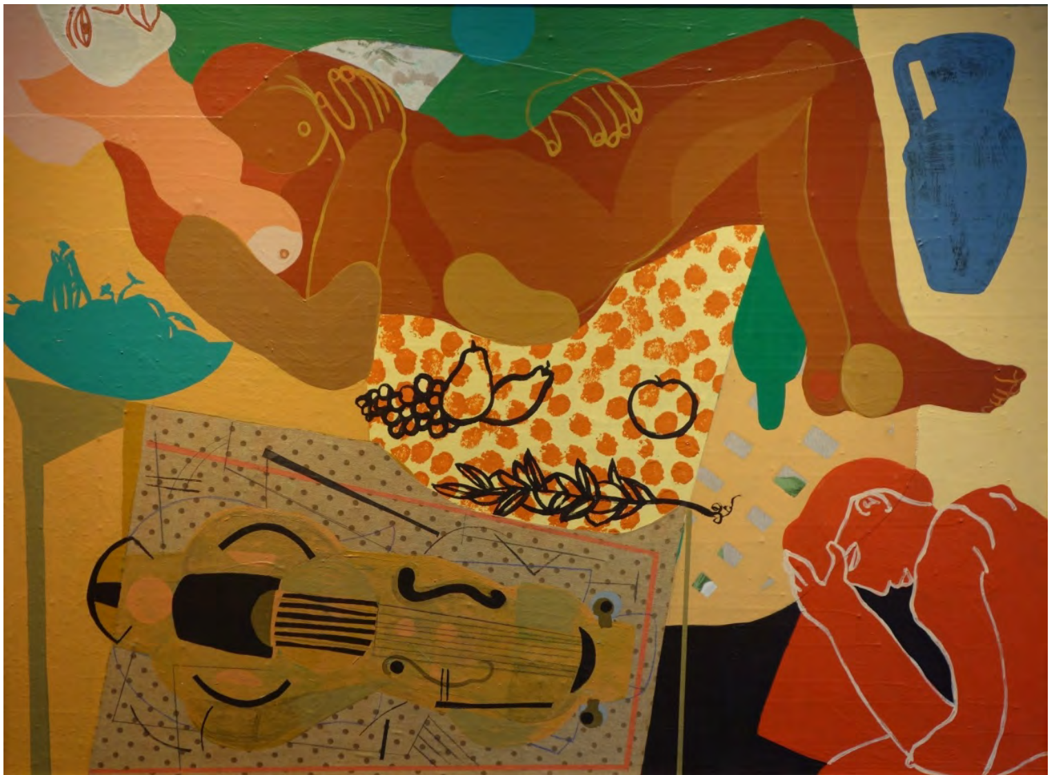
El estudio. 96 x 128 cm. Acrílico/tabla. 2015