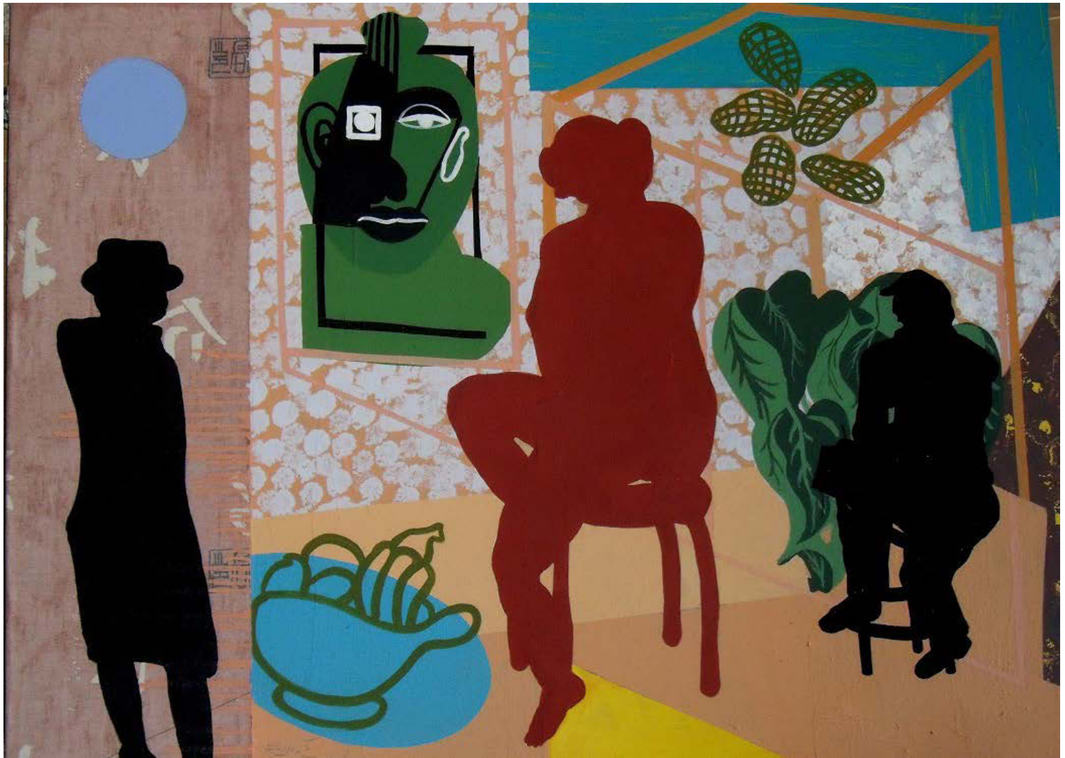
El estudio. 96 x 128 cm. Acrílico/tabla. 2015.