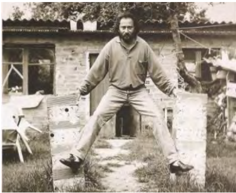
Estudio St.Cugat. 1985

Fundación Noesis, Calaceite, Teruel. Galería Chys, Teruel.